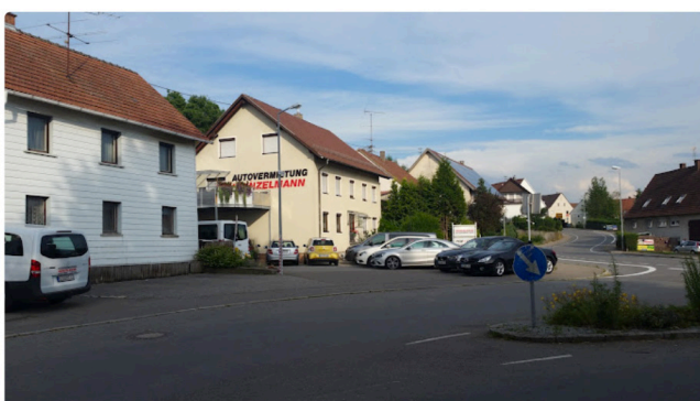
Verlässlich, flexibel und persönlich. seit über 25 Jahren steht die Autovermietung Heinzelmann für maßgeschneiderte Mobilitätslösungen in Oberschwaben. Unser erfahrenes Team berät Sie individuell und sorgt für eine unkomplizierte